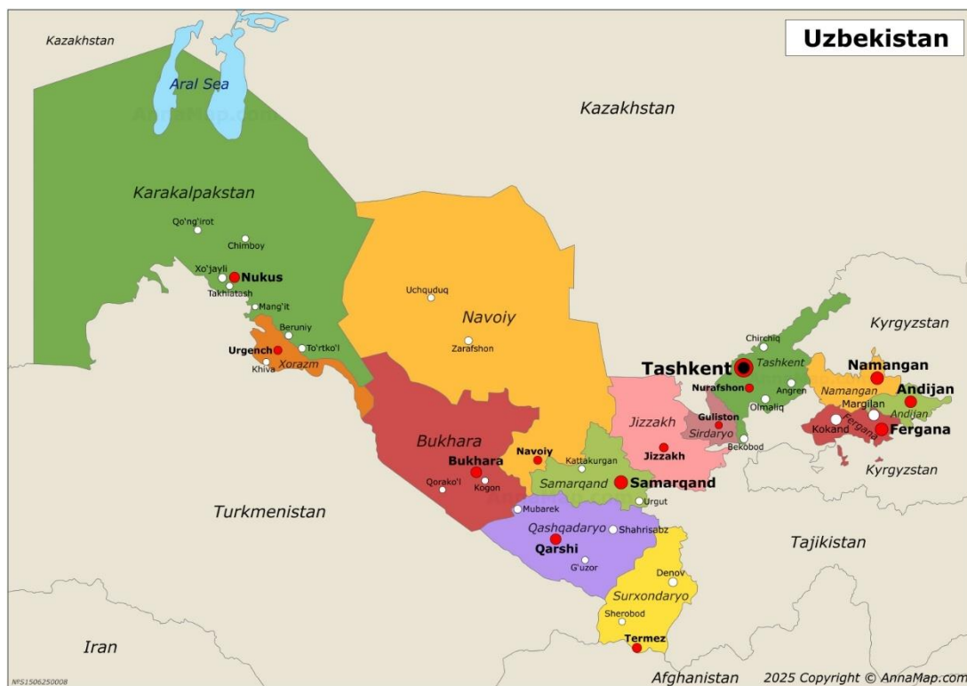
1-rasm: O'zbekiston va qo'shni davlatlar xaritasi

3. Loyihaning joylashuvi. Bu loyiha O'zbekiston Respublikasining butun hududida amalga oshiriladi (1-rasm). U O'zbekistondagi gaz sohasi bo'yicha davlat korxonalarida metan chiqindilarini kamaytirish va aktivlarni boshqarish salohiyatini oshirishga yo'naltirilgan.